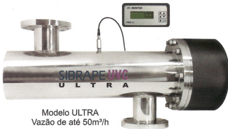
Modelo ULTRA Vazão de até 50m 3 /h

Mais informações visite nosso site www.sibrapeuvc.com.br 0800 727 3737